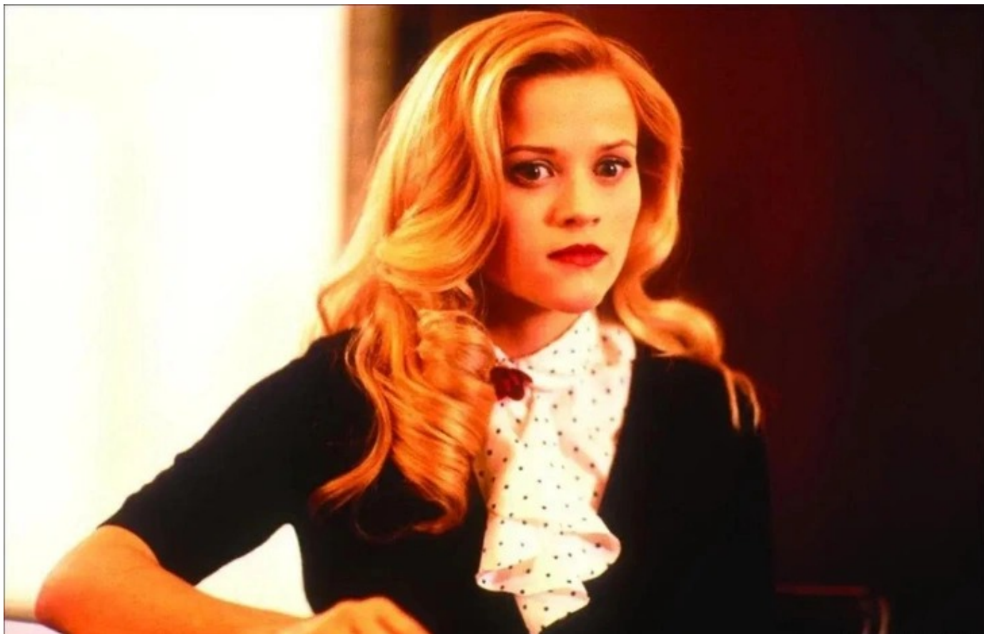
Фото: Кадр из фильма «Блондинка в законе»