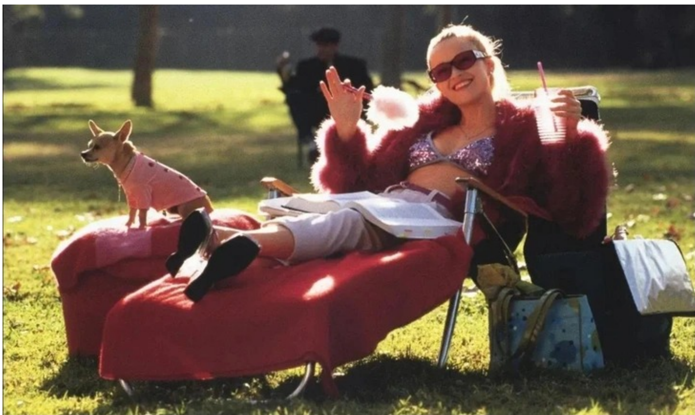
Фото: Кадр из фильма «Блондинка в законе»