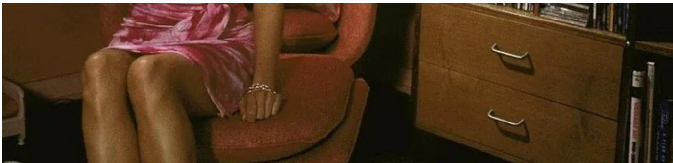
Фото: Кадр из фильма «Блондинка в законе»