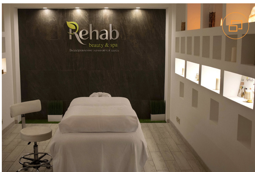
К услугам пациентов – массажный кабинет

«В Rehab Family мы предоставляем пациентам комплексную мультимодальную терапию, которая каждый раз подбирается индивидуально, – резюмирует Юлия Рязанова. – И сегодня за профессиональной психологической помощью к нам приходят самые разные люди. Это клиенты с высоким уровнем рефлексии, для которых индивидуальный подход, комфортная, дружелюбная атмосфера и качество услуг имеют большое значение».