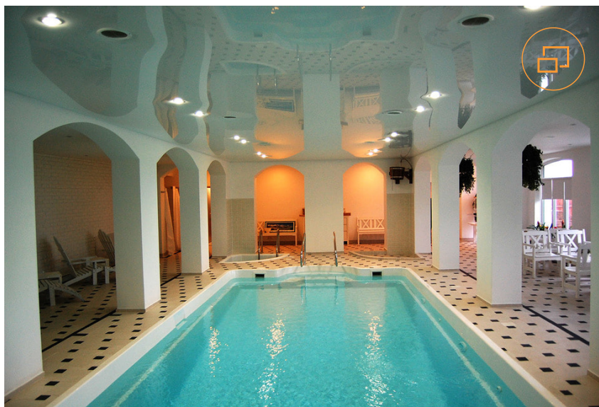
Плавание отлично снимает стресс

Для путешествия навстречу новой жизни без стрессов, зависимостей и внешних раздражителей в клинике Rehab Family созданы максимально комфортные условия.