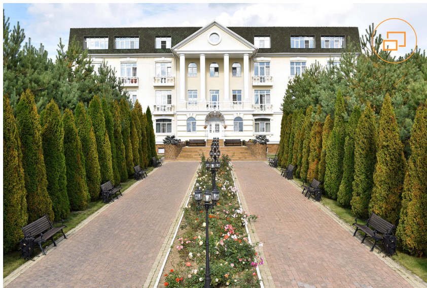
Здание Rehab Family расположено на берегу Икшинского водохранилища

«Стресс – это древний, мощный, бессознательный механизм нашей защиты от внешних опасностей, который вовлекает в процесс огромные внутренние резервы организма. Ученые выявили, что в такой ситуации человек, как правило, заедает стресс, отдавая предпочтение продуктам более жирным и сладким, которые ментально дают ощущение прилива сил, снижая тем самым физическую активность. И конечно, чаще всего стресс проявляется на работе», – подчеркивает Юлия Рязанова, клинический психолог Rehab Family.